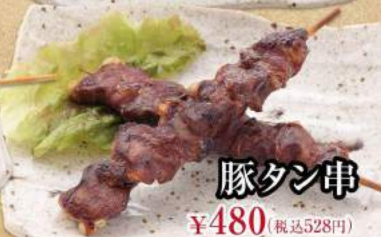
豚タン串 ¥480 (税込528円)