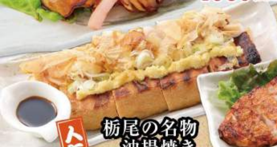
栃尾の名物 油揚げ焼き