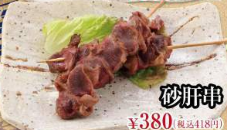
砂肝串 ¥380 (税込418円)