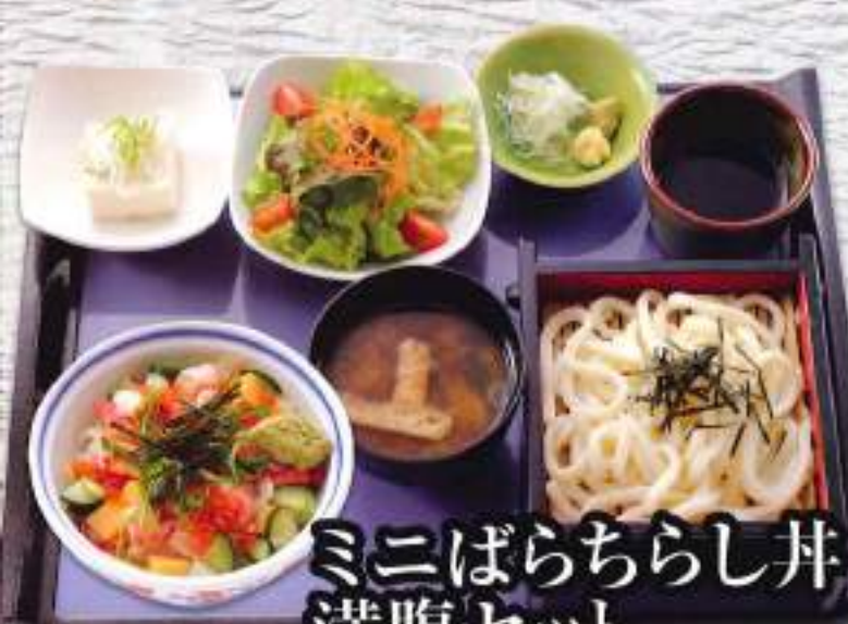
ミニばらちらし丼 満腹セット