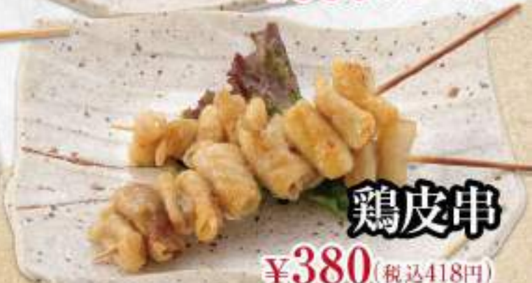
鶏皮串 ¥380 (税込418円)