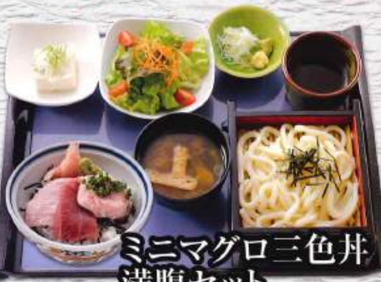
ミニマグロ三色丼 満腹セット