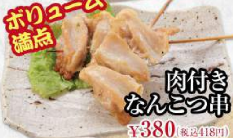
肉付き なんこつ串 ¥380 (税込418円)