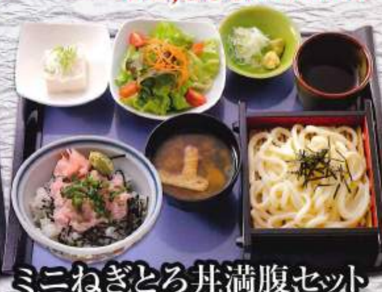
ミニねぎとろ丼満腹セット