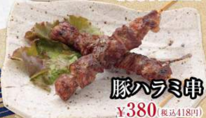
豚ハラミ串 ¥380 (税込418円)