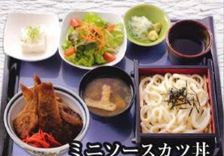
ミニソースカツ丼 満腹セット ¥980 (税込1,078円)