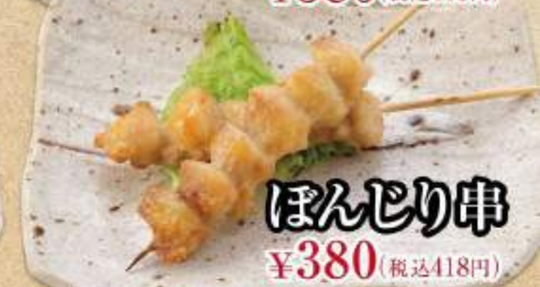
ほんじり串 ¥380 (税込418円)