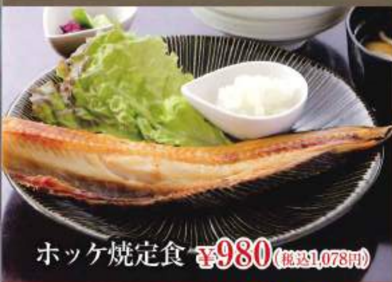
ホッケ焼定食 ¥980 (税込1,078円)