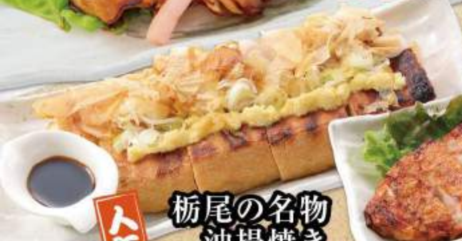
栃尾の名物 油揚げ焼き