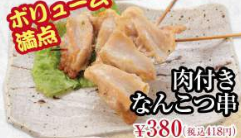
肉付き なんこつ串 ¥380 (税込418円)