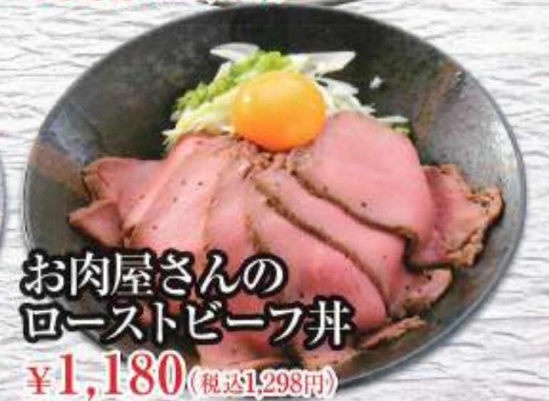
お肉屋さんの ローストビーフ丼