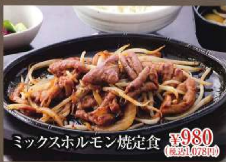
ミックスホルモン焼定食 ¥980 (税込1,078円)