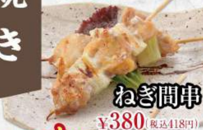
ねぎ間串 ¥380 (税込418円)