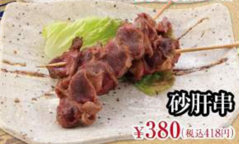
砂肝串 ¥380 (税込418円)