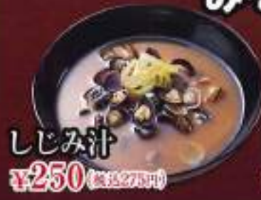
しじみ汁 ¥250 (税込275円)