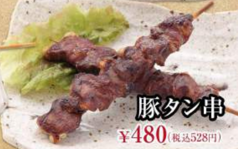
豚タン串 ¥480 (税込528円)