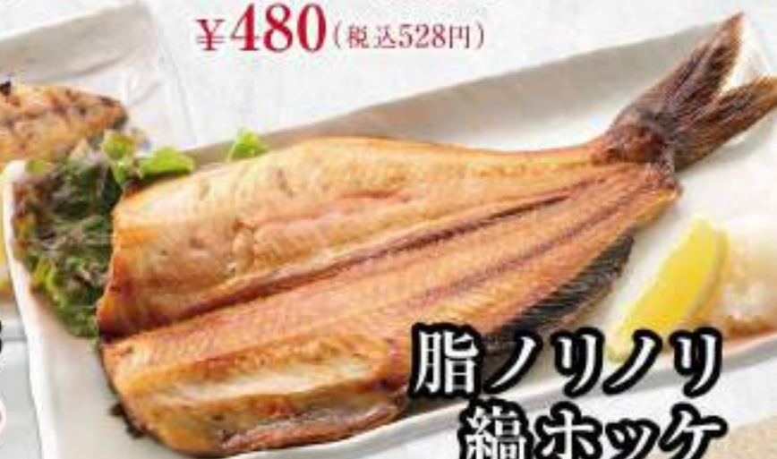
脂ノリノリ 縞ホッケ