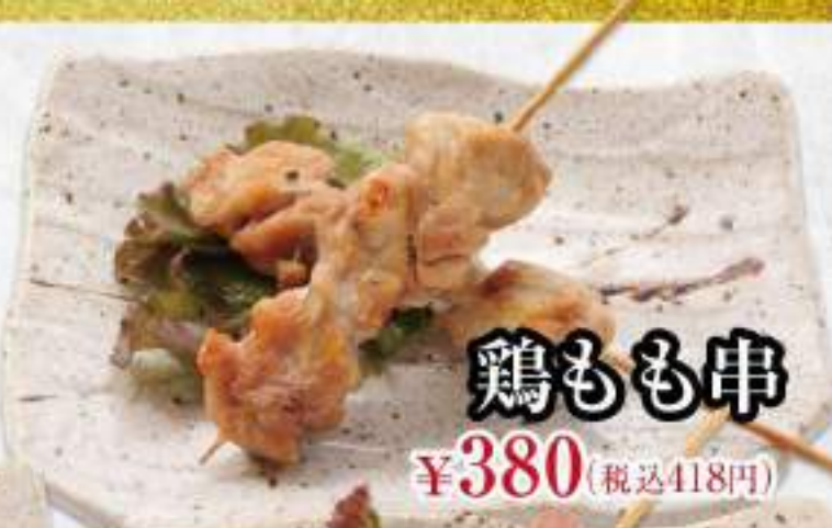
鶏もも串 ¥380 (税込418円)