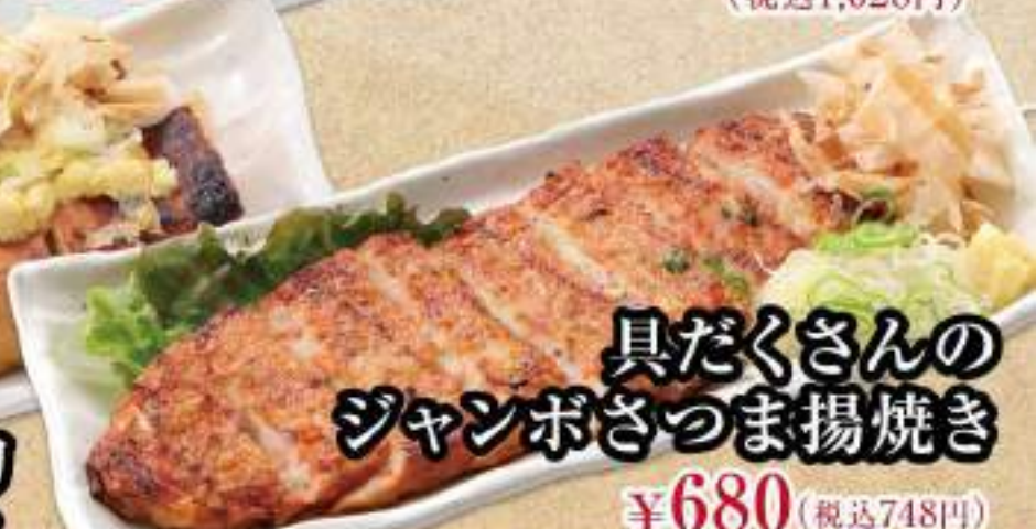
具だくさんの ジャンボさつま揚げ焼き