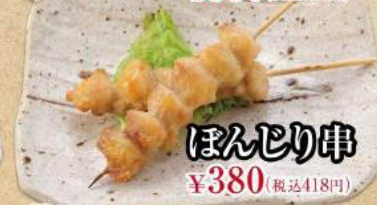
ぽんじり串 ¥380 (税込418円)