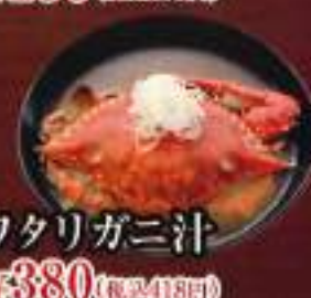
ワクリガニ汁 ¥380 (税込418円)