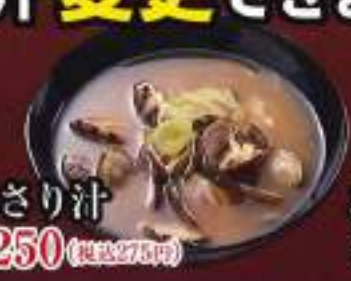
あさり汁 ¥250 (税込275円)