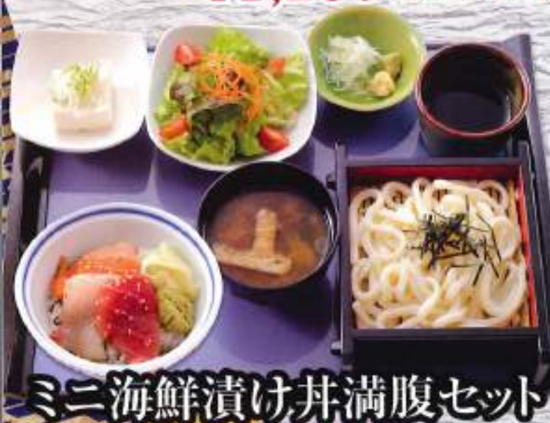
ミニ海鮮漬け丼満腹セット