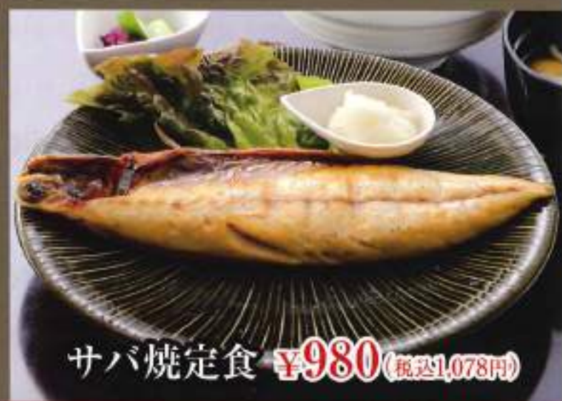
サバ焼定食 ¥980 (税込1,078円)