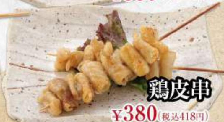
鶏皮串 ¥380 (税込418円)