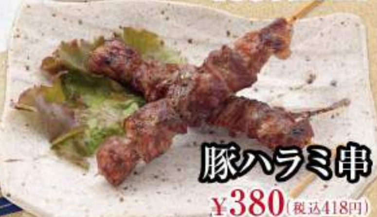
豚ハラミ串 ¥380 (税込418円)