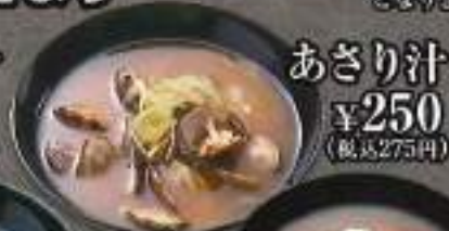
あさり汁 ¥250 (税込275円)