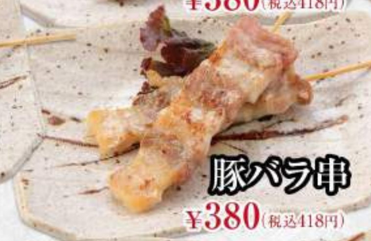
豚バラ串 ¥380 (税込418円)