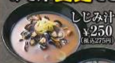
しじみ汁 ¥250 (税込275円)