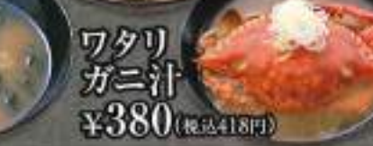
ワタリガニ汁 ¥380 (税込418円)