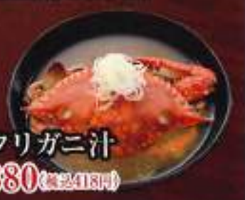
ワタリガニ汁 ¥380 (税込418円)