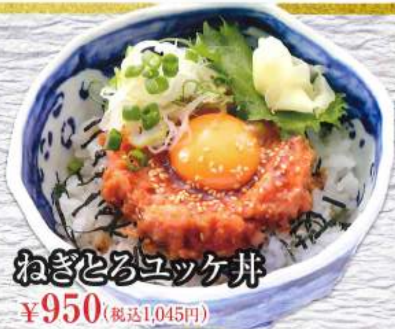
ねぎとろユッケ丼