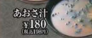
あおさ汁 ¥180 (税込198円)