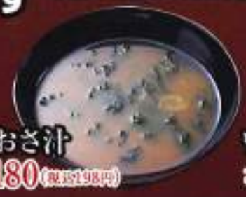
あおさ汁 ¥180 (税込198円)