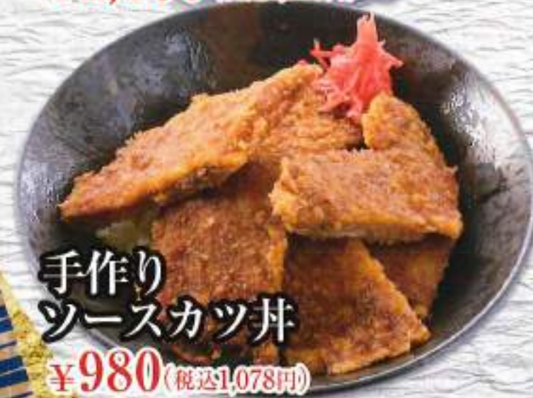
手作り ソースカツ丼