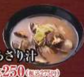
あさり汁 ¥250 (税込275円)