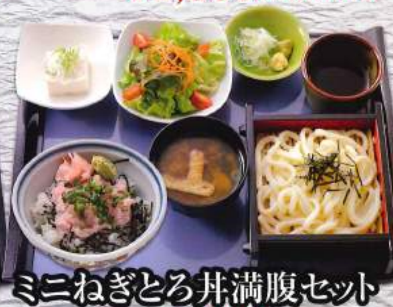
ミニねぎとろ丼満腹セット