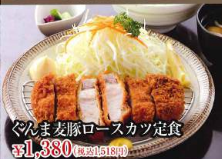
ぐんま麦豚ロースカツ定食