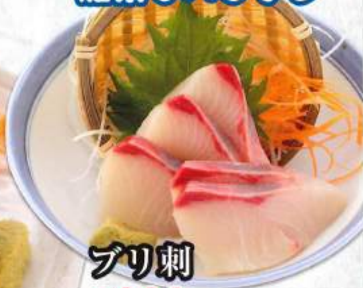
ブリ刺 ¥880 (税込968円)