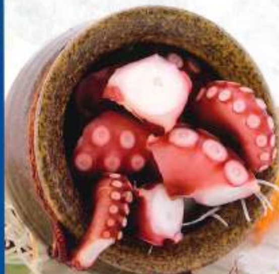
たこぶつ ¥780 (税込858円)