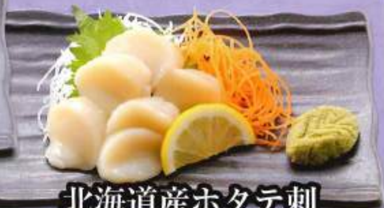
北海道産ホタテ刺 ¥780 (税込858円)