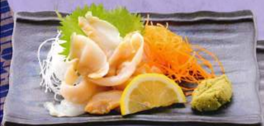
コリコリ食感のつぶ貝刺 ¥780 (税込858円)