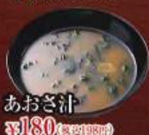
あおさ汁 ¥180 (税込198円)