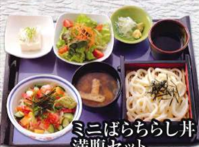
ミニばらちらし丼 満腹セット