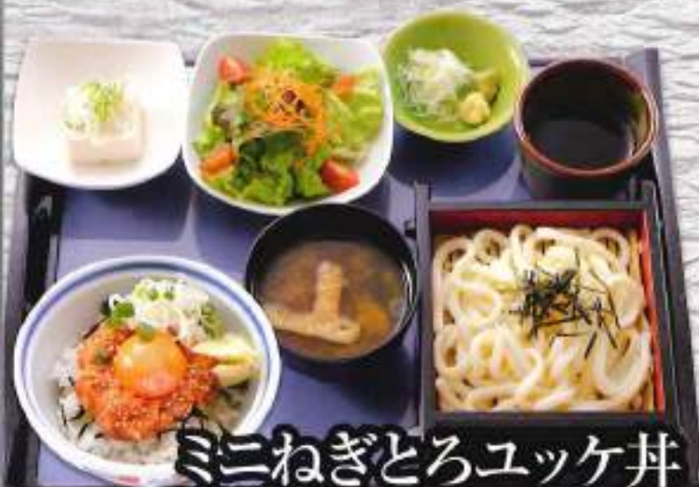
ミニねぎとろユッケ丼 満腹セット ¥950 (税込1,045円)