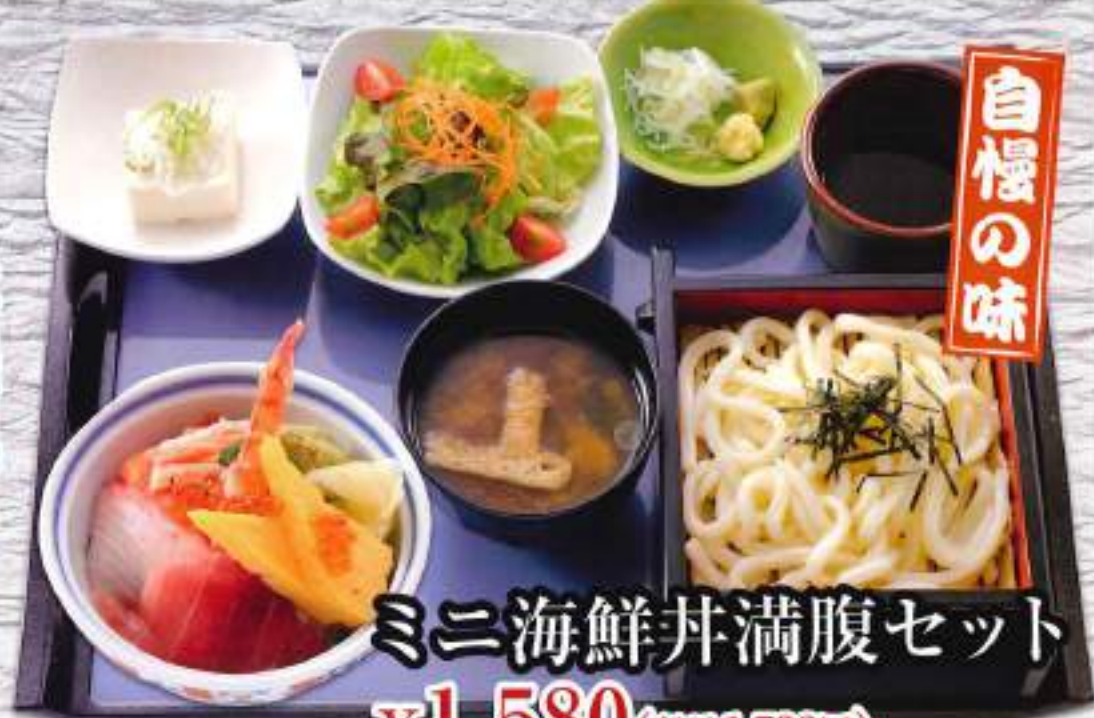
ミニ海鮮丼満腹セット ¥1,580 (税込1,738円)