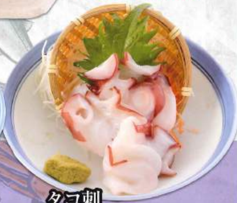
タコ刺 ¥780 (税込858円)