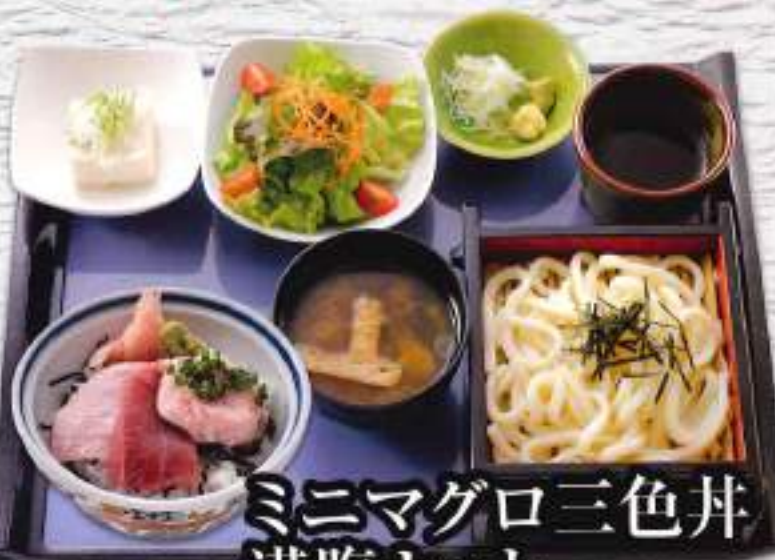
ミニマグロ三色丼 満腹セット