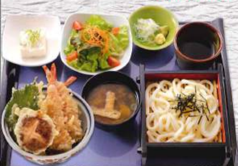
ミニ天丼満腹セット ¥980 (税込1,078円)