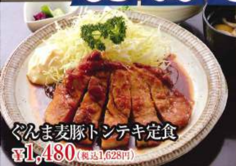
ぐんま麦豚トンテキ定食