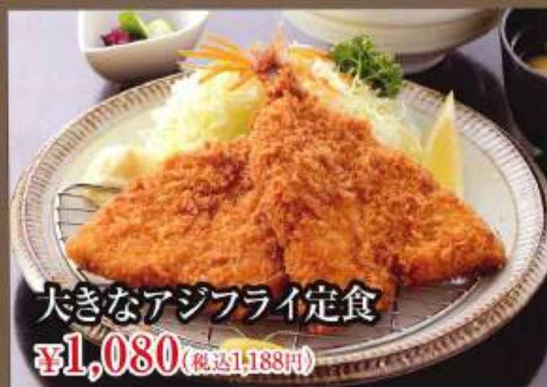
大きなアジフライ定食