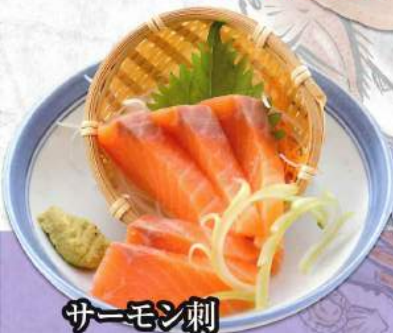
サーモン刺 ¥780 (税込858円)