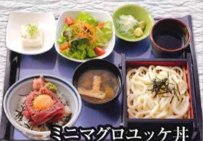
ミニマグロユッケ丼 満腹セット ¥1,100 (税込1,210円)