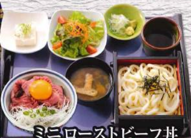
ミニローストビーフ丼 満腹セット ¥1,180 (税込1,298円)