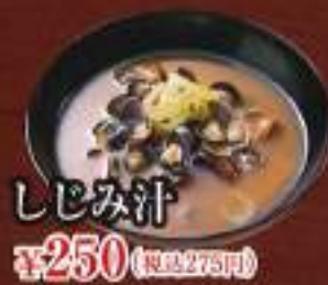
しじみ汁 ¥250 (税込275円)