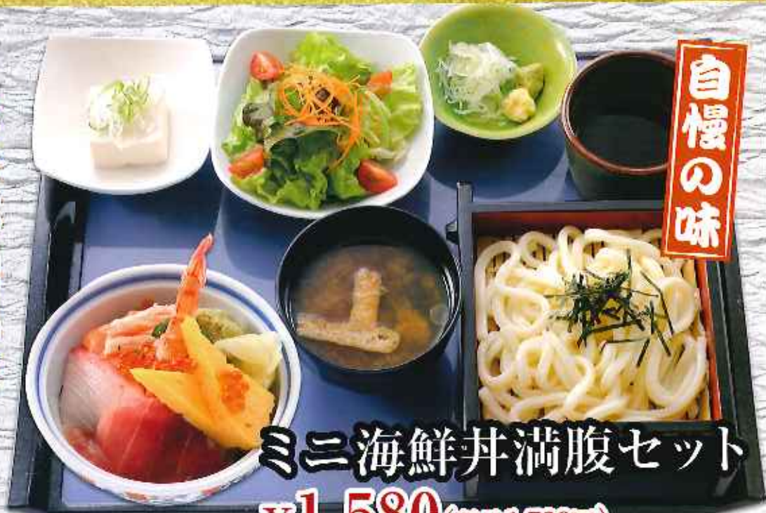
ミニ海鮮丼満腹セット ¥1,580 (税込1,738円)