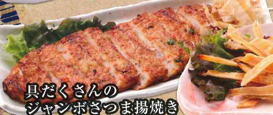
具だくさんの ジャンボさつま揚げ焼き