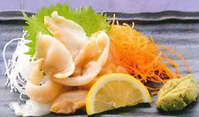
ヨリヨリ食感のつぶ貝刺