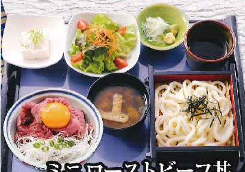
ミニローストビーフ丼 満腹セット ¥1,080 (税込1,188円)