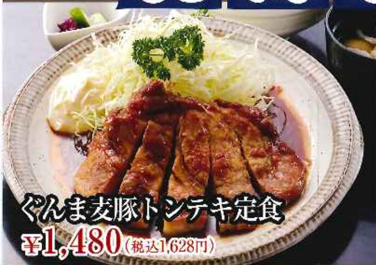
ぐんま麦豚トンテキ定食