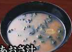
あおさ汁 ¥180 (税込198円)