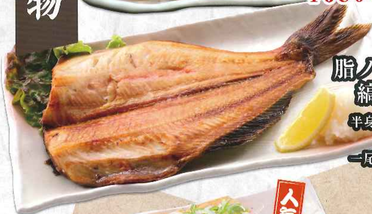
脂ノリノリ 縞ホツケ