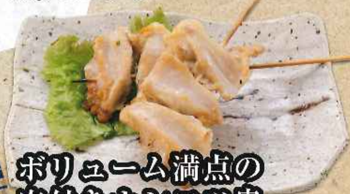
ボリューム満点の 肉付きナンコツ串