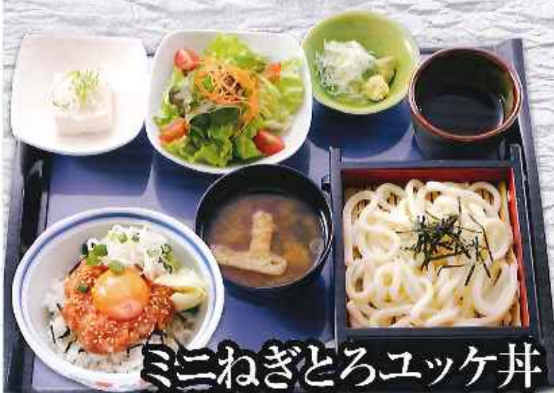
ミニねぎとろユツケ丼 満腹セット ¥950 (税込1,045円)