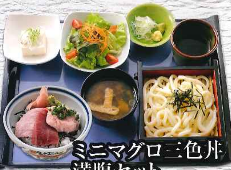
ミニマグロ三色丼 満腹セット ¥1,380 (税込1,518円)