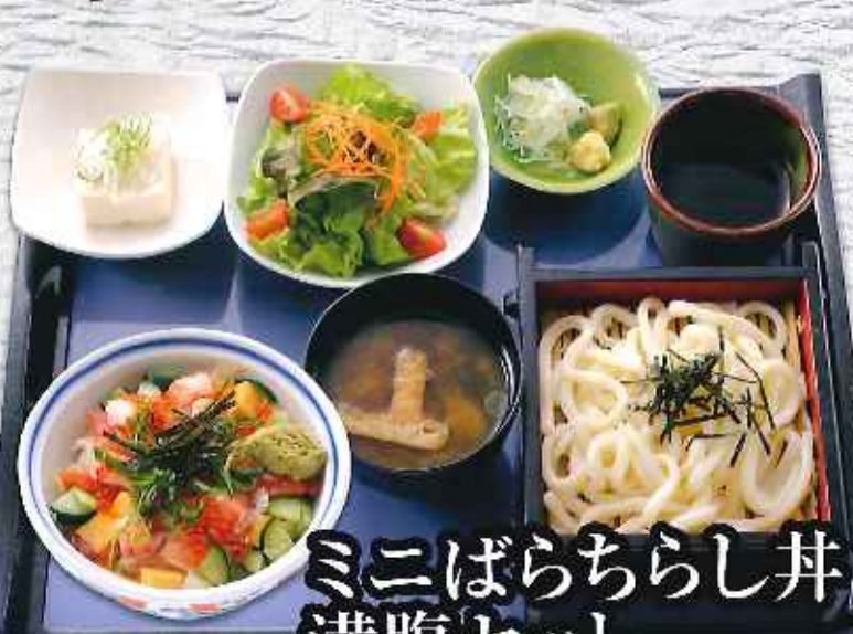
ミニばらちらし丼 満腹セット ¥1,280 (税込1,408円)