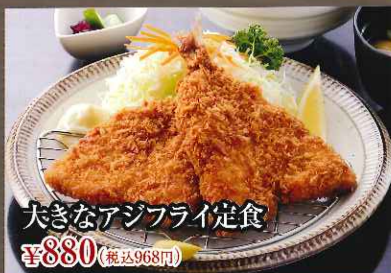
大きなアジフライ定食