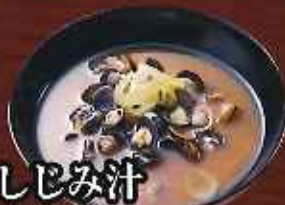
しじみ汁 ¥250 (税込275円)