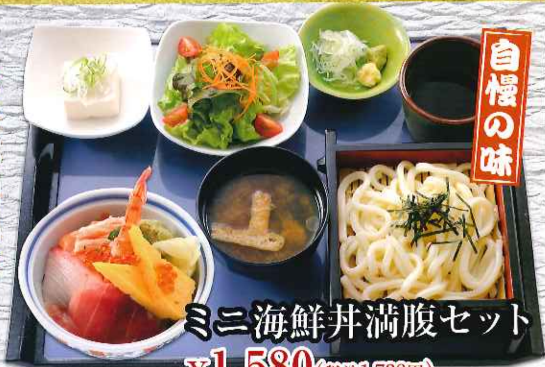
ミニ海鮮丼満腹セット ¥1,580 (税込1,738円)