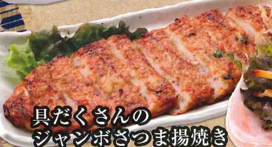
具だくさんの ジャンボさつま揚げ焼き