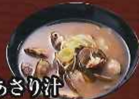
あさり汁 ¥250 (税込275円)