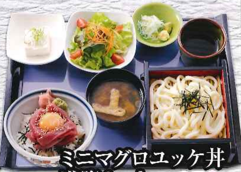
ミニマグロユツケ丼 満腹セット ¥950 (税込1,045円)