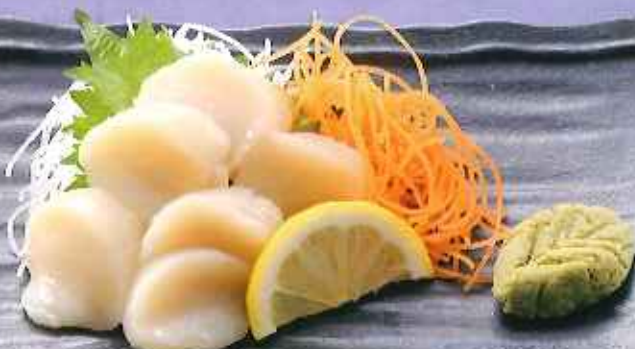
北海道産ホタテ刺