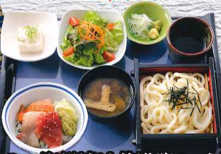
ミニ海鮮漬け丼満腹セット ¥1,080 (税込1,188円)