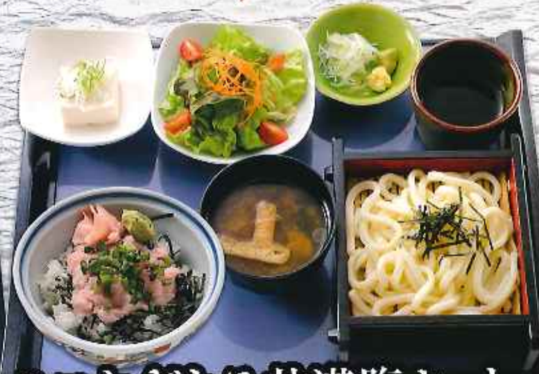
ミニねぎとろ丼満腹セット ¥850 (税込935円)