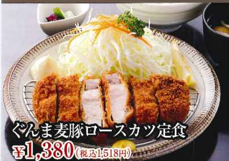
ぐんま麦豚ロールカツ定食