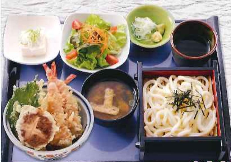
ミニ天丼満腹セット ¥980 (税込1,078円)