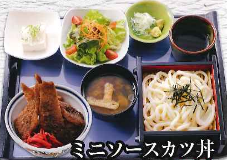
ミニソースカツ丼 満腹セット ¥880 (税込968円)