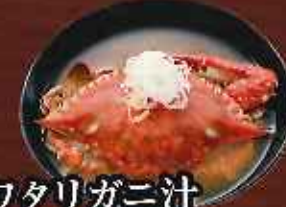
ワタリガニ汁 ¥380 (税込418円)