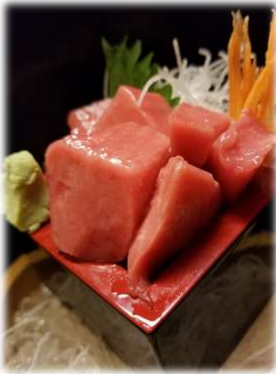
本まぐろ中トロブツ