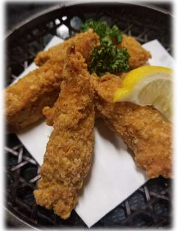
スパイスチキンバー